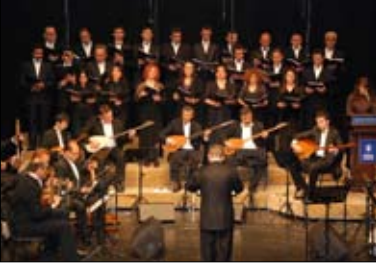
Orkestra Şube Müdürlüğü Türk Halk Müziği Topluluğu