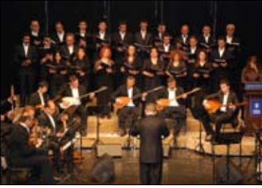
Orkestra Şube Müdürlüğü Türk Sanat Müziği Topluluğu