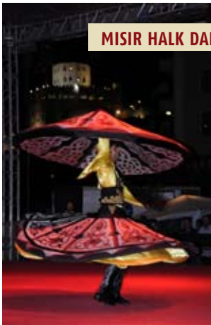
MISIR HALK DANSLARI